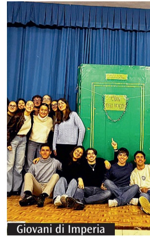
Giovani di Imperia

ospite è stato padre Michele, agostiniano, che ha guidato l'attività sulle "etichette" che si danno e si ricevono: su alcuni posti- it trenta partecipanti hanno scritto il "marchio" che ciascuno ritiene di ricevere e, una volta raccolti e letti, sono passati a ideare scenette sul loro futuro fra 10 anni. La serata è stata accompagnata dal confronto e si è conclusa con la consegna ad ognuno di una frase "segreta" su sogni e felicità. (G.R.)