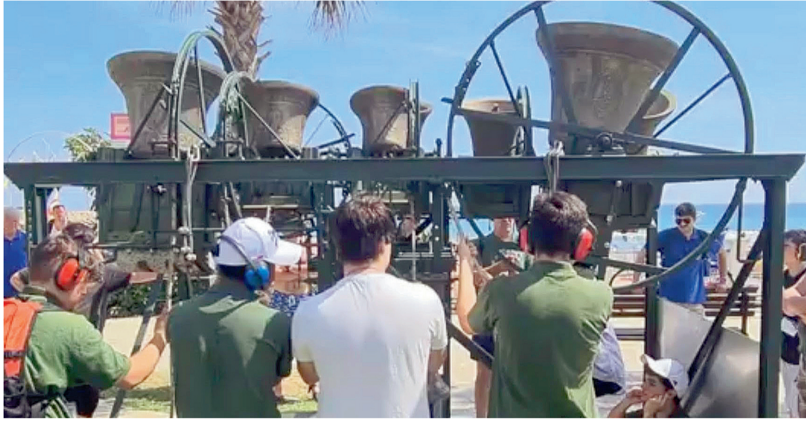
Andora, campanari in azione durante il raduno nazionale

Santificazione sacerdotale Venerdì 12 giugno, il seminario vescovile di Albenga ospiterà la Giornata della Santificazione Sacerdotale; ospite monsignor Giovanni Roncari, O.F.M. Cap., vescovo emerito di Grosseto e di Pitigliano-Sovana-Orbetello. Pensiero critico Sabato 13 giugno a Pietra Ligure il gruppo scout Valmaremola 2 organizza l'incontro "Come lo scautismo educa al pensiero critico". Interverranno Francesca Naselli (psicoterapeuta), Matteo Pasqual (pedagogista) e Tommaso Torre. Adorazione ad Andora Presso la parrocchia del Cuore Immacolato di Maria, sabato 13 giugno, la Fraternità Vivere da Dio promuove "Venite e vedrete!", adorazione eucaristica con inizio alle ore 21; a seguire momento conviviale.