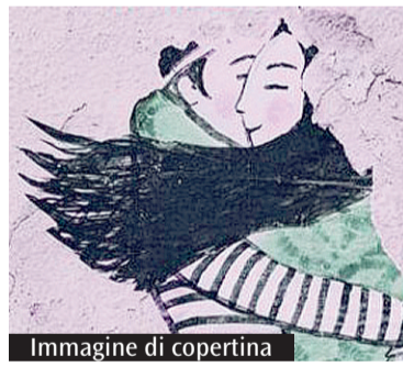
Immagine di copertina