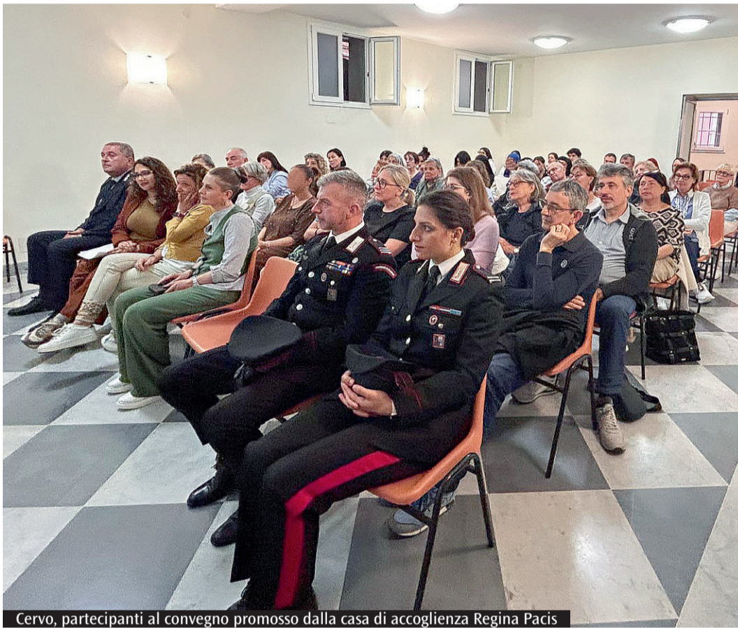
Cervo, partecipanti al convegno promosso dalla casa di accoglienza Regina Pacis

è stata evidenziata la necessità, per gli adulti, di essere modelli credibili nell'utilizzo delle tecnologie: a differenza degli adolescenti di oggi, infatti, le vecchie generazioni hanno conosciuto una vita priva di smartphone e social network, maturando la capacità di distinguere tra dimensione reale e digitale; per molti giovani, invece, il mondo online è un'estensione naturale della propria identità e un canale fondamentale per