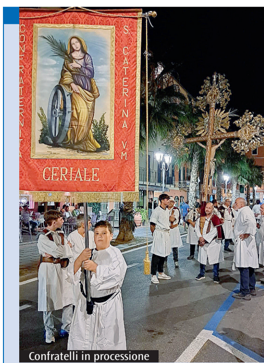
Confratelli in processione

la Settimana Santa. Per la carità, seguiamo le orme della nostra storia: oggi mettiamo l'oratorio a disposizione per le veglie dei defunti e collaboriamo alle attività ludico-ricreative e caritative della parrocchia. Curiamo inoltre con molta attenzione il decoro e il restauro delle opere d'arte sacra. Su quali aspetti intendete lavorare per il futuro? Vogliamo incrementare ulteriormente la formazione catechistica e le attività caritative, che sono il compito principale della nostra associazione fin dalle origini. La visibilità che abbiamo nel centro di Ceriale ci stimola a sensibilizzare sempre nuovi giovani affinché si avvicinino alla vita della Confraternita.