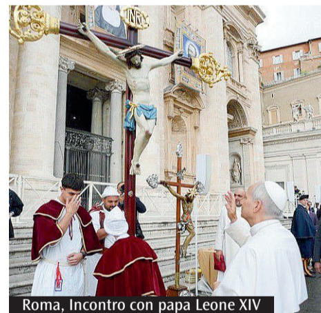
Roma, incontro con papa Leone XIV

fratelli hanno mantenuto questo spirito di sacrificio fino ai giorni nostri, partecipando attivamente con manodopera pratica al restauro dell'oratorio conclusosi nel 2021. Tra le opere custodite, spicca una statua dell'Immacolata in cartapesta del XVIII secolo e la statua della titolare Santa Caterina, un gioiello in legno policromo del Settecento. Una particolarità delle processioni è il forte accento posto sulla testimonianza di fede attraverso i crocifissi processionali, considerati dai confratelli non come semplici oggetti della tradizione ligure, ma come simboli vivi della perseveranza cerialese. Questa capacità di risorgere dalle macerie della storia, dalle incursioni barbaresche alle profanazioni napoleoniche, rende i confratelli di Santa Caterina un simbolo di identità e tenacia per tutta la comunità di Ceriale. (S.D.P.)