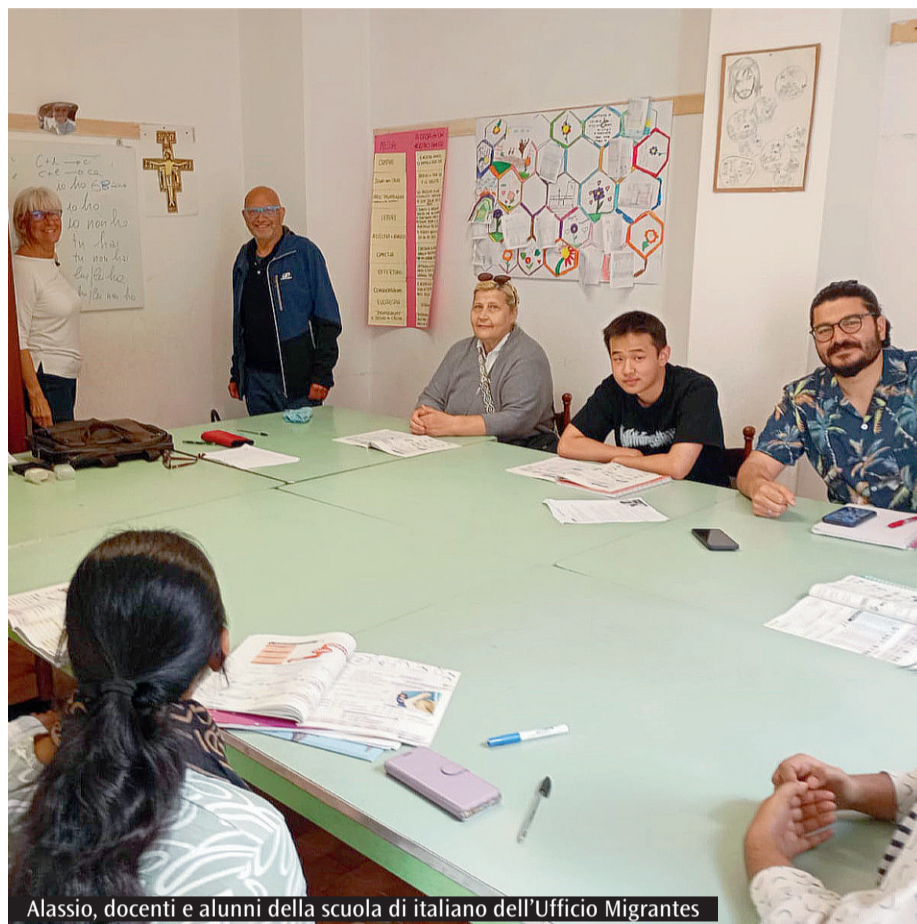
Alassio, docenti e alunni della scuola di italiano dell'Ufficio Migrantes

potresti in qualche modo contribuire al miglioramento». Nella scuola di italiano arrivano persone molto diverse sia per età sia per formazione culturale. Alcuni parlano già francese o inglese e devono "solo" imparare l'italiano. Altre sono persone adulte che, non essendo mai andate a scuola, all'inizio faticano anche ad impugnare correttamente una penna. Inoltre, aggiunge Simona: «Durante l'anno scolastico abbiamo iniziato anche un progetto di formazione sul mondo del lavoro con la CGIL di Savona. Molti dei nostri studenti, infatti, lavorano e non sempre alle giuste condizioni. Informarli dei loro diritti è un servizio in più che la scuola offre. Il giornalista di Altraeconomia Salvatore Lucente, nell'ambito di un'inchiesta sui lavoratori immigrati nel territorio di Alben-