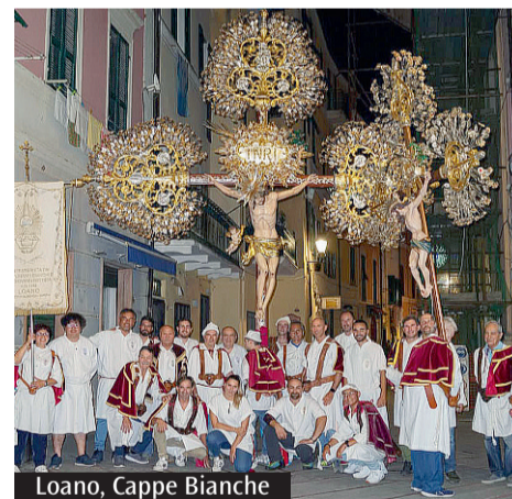
Loano, Cappe Bianche

Quali sono le sfide future per la Confraternita dei Bianchi? L'obiettivo è continuare a curare con amore il nostro oratorio, che è un centro di fede e arte per tutta Loano. Puntiamo molto sulla formazione religiosa e morale, seguita dal Maestro dei Novizi, perché diventare confratelli richiede consapevolezza e un anno di noviziato. Vogliamo che l'affetto che i loanesi ci dimostrano continui a tradursi in una partecipazione viva alla vita della Chiesa.