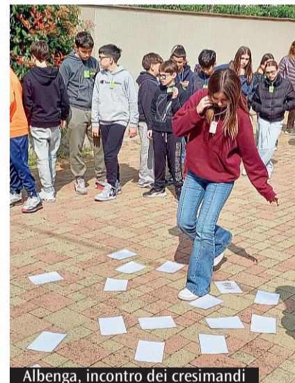
Albenga, incontro dei cresimandi