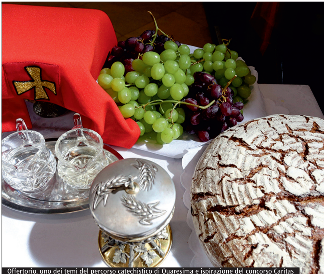
Offertorio, uno dei temi del percorso catechistico di Quaresima e ispirazione del concorso Caritas

domenica fino a Pasqua, che fanno da corona al titolo, al centro. Ogni domenica verrà applicata sul tondo un'immagine descrittiva del momento della Santa Messa che viene analizzata. Inoltre, l'Ufficio Caritas, in collaborazione con l'Ufficio diocesano per la Catechesi, indice un concorso in occasione del Cinquantenario di fondazione della Caritas Diocesana da svolgersi nel Tempo di Quaresima. Il concorso, rivolto ai gruppi di