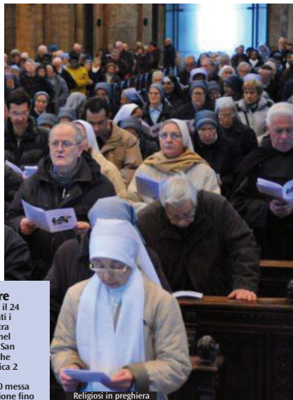
Religiosi in preghiera

D omenica prossima, festa della Presentazione di Gesù al Tempio, la celebrazione con i religiosi e le religiose della diocesi per la giornata della vita consacrata, si terrà ad Alassio, tra l'istituto don Bosco e la parrocchia di sant'Ambrogio. I salesiani quest'anno celebrano i 150 anni della loro presenza in città. La celebrazione inizierà alle 11.15 nella chiesa della Madonna degli Angeli, con l'apertura dell'anno giubilare. Si formerà poi la processione verso la chiesa parrocchiale di sant'Ambrogio, dove il vescovo Borghetti presiederà la messa e il rinnovo dei voti da parte dei religiosi presenti. Al termine della celebrazione sarà offerto il pranzo (un primo) presso l'istituto salesiano; alle 15 ci sarà la possibilità di vedere lo spettacolo teatrale "Santa Impresa".