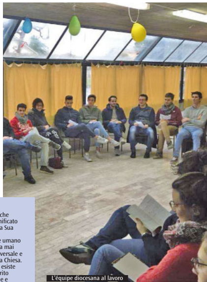
L'équipe diocesana al lavoro