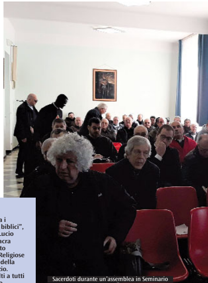
Sacerdoti durante un'assemblea in Seminario

Il corso di approfondimento biblico sarà articolato in 13 incontri, che si terranno nei seguenti giorni: 8 e 15 ottobre, 12 e 19 novembre, 10 dicembre, 14 e 21 gennaio, 11 e 18 febbraio, 10 e 17 marzo, 14 e 21 aprile. Gli appuntamenti si svolgeranno dalle ore 21:00 alle ore 22 circa, presso le opere parrocchiali della parrocchia dei SS. Maurizio e CC. Martiri di via Verdi, a Imperia. Il corso è, inoltre, accreditato dall'Ufficio per la scuola (Irc) e la pastorale scolastica, ai fini dell'aggiornamento professionale.